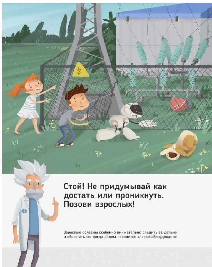
Рис. 5 Стой! Не придумывай как достать или проникнуть. Позови взрослых!