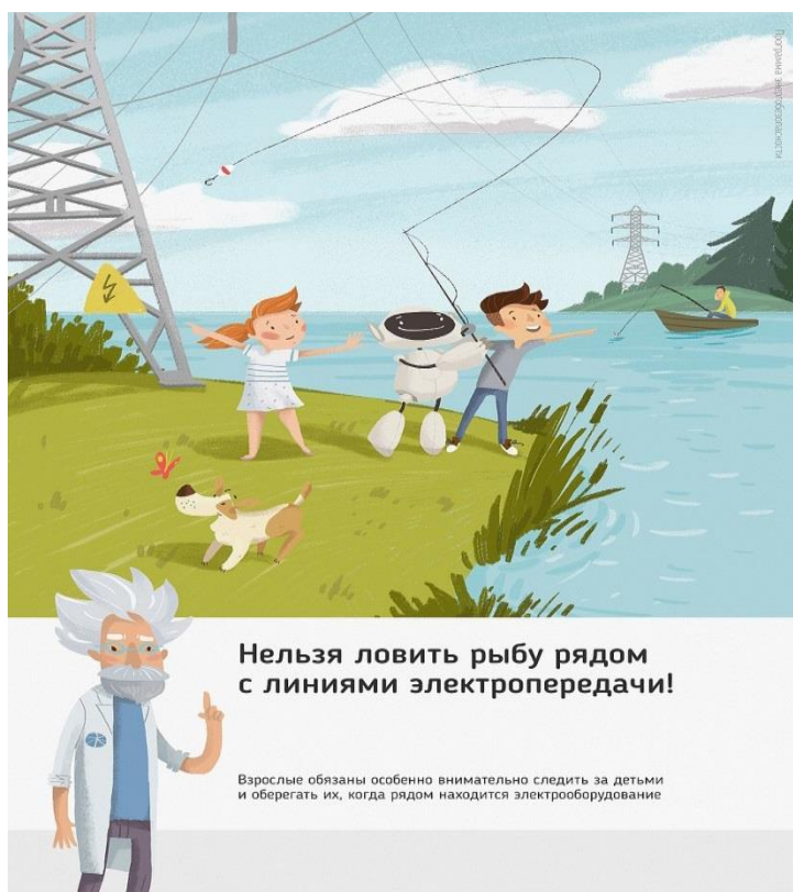
Рис. 4 Нельзя ловить рыбу рядом с линиями электропередачи

Об открытых подстанциях, оборванных проводах нужно сообщить в Кубанское ПМЭС по телефону 8-861-219-40-20 или позвонить на единый телефон всех экстренных служб 112.