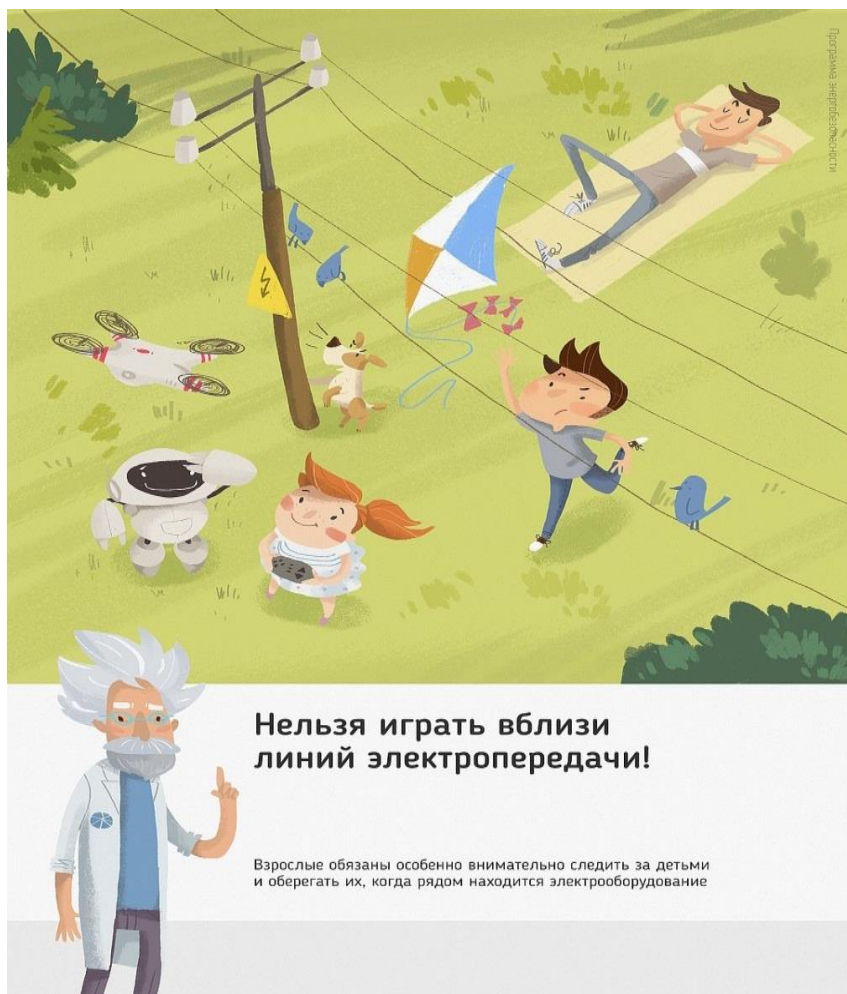
Рис.3 Нельзя играть вблизи линий электропередачи