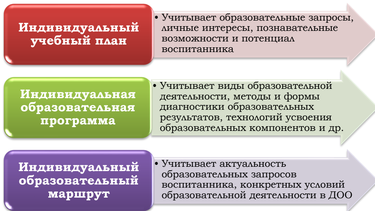
Рисунок 1 Уровни индивидуализации дошкольного образования

На рисунке 1 изображены возможные уровни индивидуализации дошкольного образования.