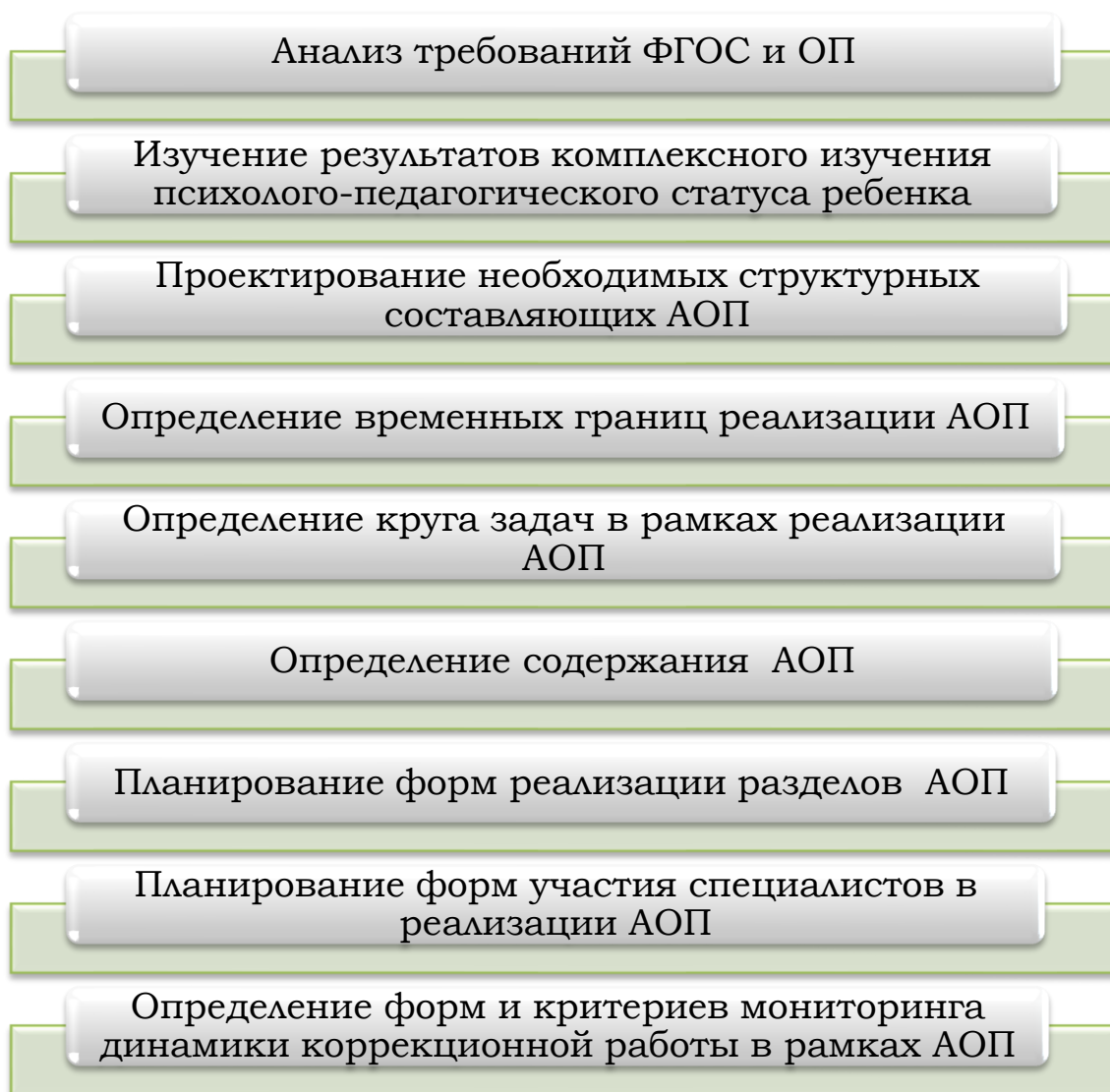
Рис.5 Алгоритм проектирования АОП

При проектировании АОП указывается отрезок времени, покрываемый реализацией содержания АОП. Выбираемый отрезок должен, как правило, состоять из одного или нескольких полугодий обучения в образовательной организации. Для отдельных категорий детей, например, с тяжелыми и множественными нарушениями, возможно планирование деятельности на более