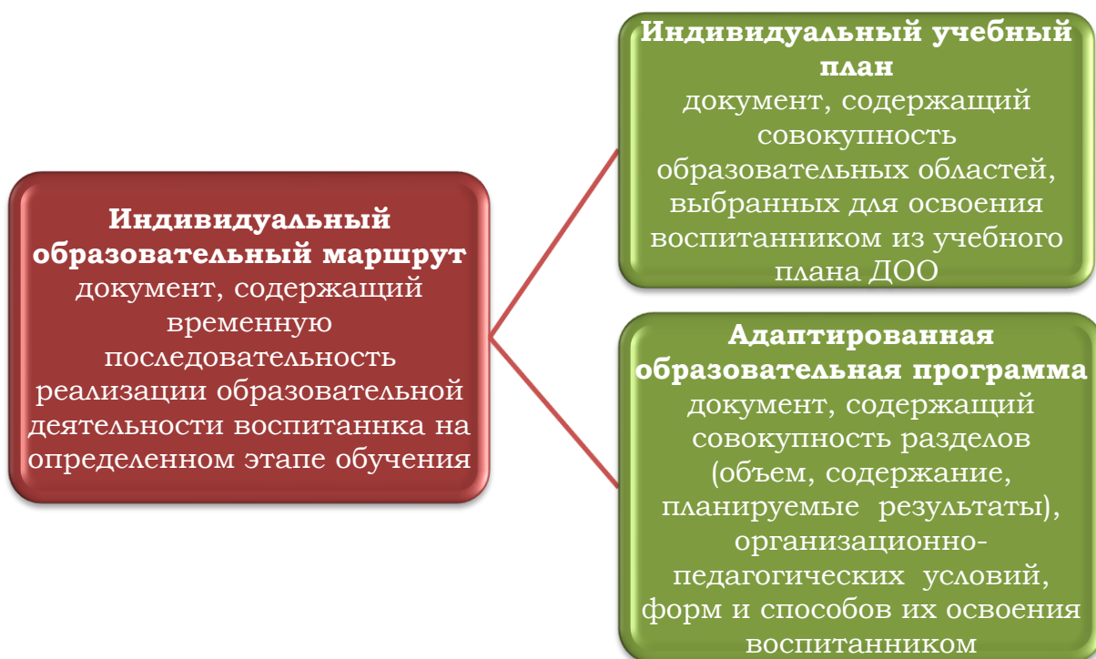
Рис. 2 Основные документы индивидуализации образования в дошкольной образовательной организации для детей с ОВЗ

будет реализована образовательная программа». Индивидуализация дошкольного образования отражается в следующих документах (см. рис 2):